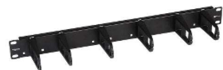
Guía de cables de 1U

Los paneles de 19" Digilink han sido diseñados para dar una solución flexible a cualquier tipo de instalación de telecomunicaciones. El panel de datos Digilink es un conjunto de 24 puertos para montaje en rack de 19". Incluyen 24 conectores modulares y guía cables traseros.