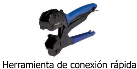
Herramienta de conexión rápida