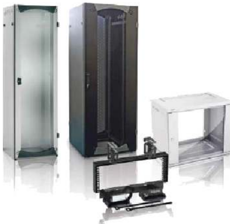
VDI Actassi envolventes para voz, datos e imagen