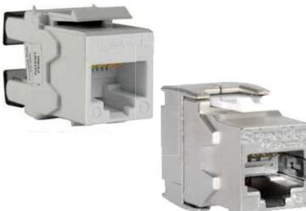
Cat. 5e / Cat. 6

Digilink dispone de conectores RJ45 Categoría 6 UTP (8 contactos) de alto rendimiento. Diseñados con huella tipo keystone para obtener una mayor flexibilidad en la instalación, conforme a la normativa IEC-60603-7-2 (conectores no apantallados 100MHz). Este diseño ha sido pensado para facilitar el montaje y desmontaje en paneles de datos y mecanismos.